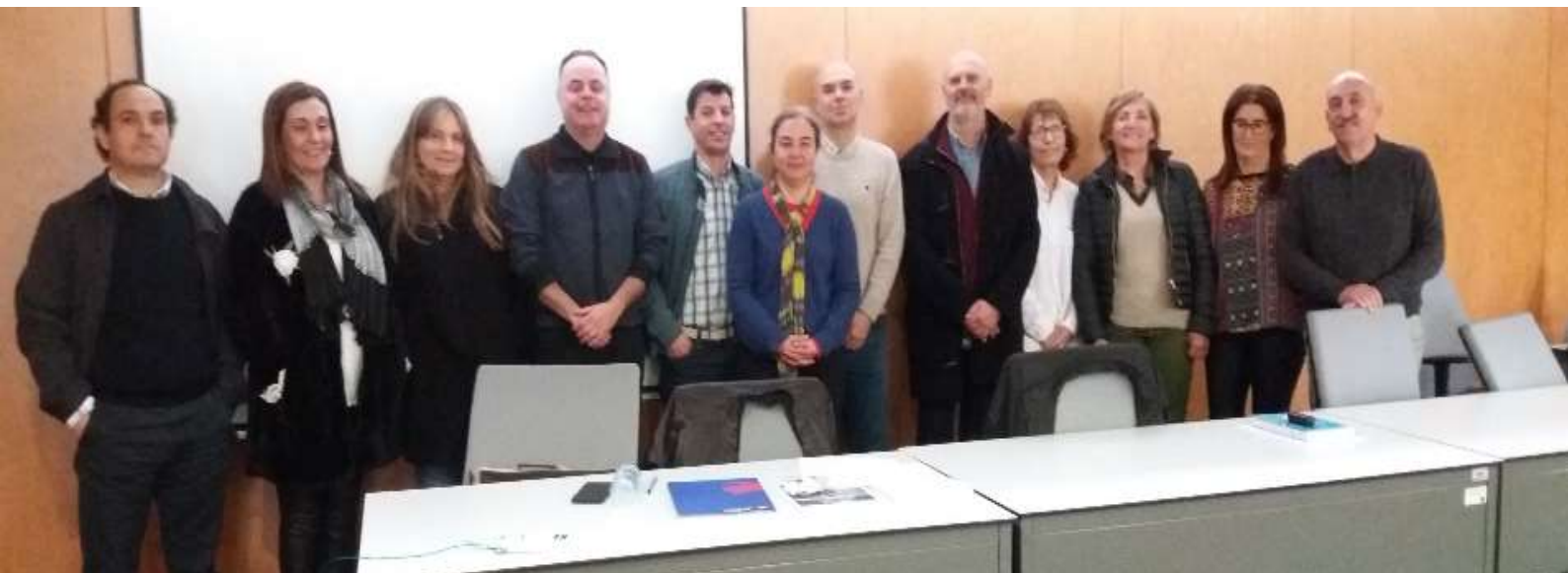
Tomada de posse dos membros da Associação Portuguesa de Educação nas Prisões (17.11.2018)